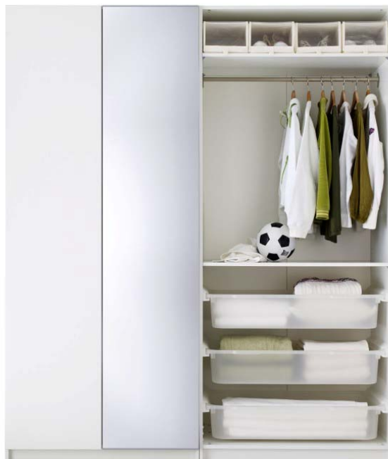
Bsp.: PAX BALLSTAD

Hilfe beim Auf- und Einbau der Möbel kann bei IKEA beauftragt werden. Mehr Infos unter: www.IKEA.de/Serviceleistungen