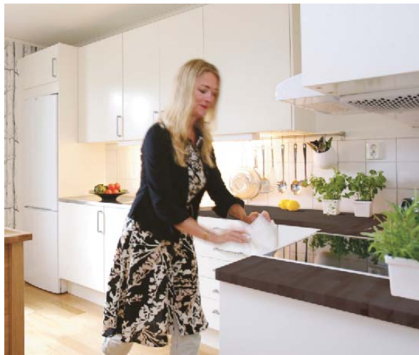
Bsp.: Küche mit APPLÅD Front

Hilfe beim Auf- und Einbau der Möbel kann bei IKEA beauftragt werden. Mehr Infos unter: www.IKEA.de/Serviceleistungen